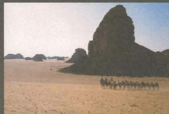
Caravana tuareg al Tassili N'Ajers (Algèria)