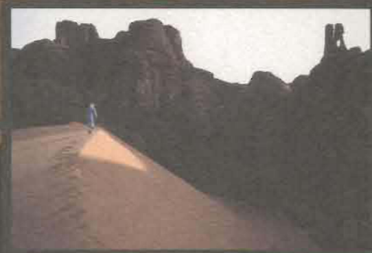
Tassili Haaggar (Algèria)