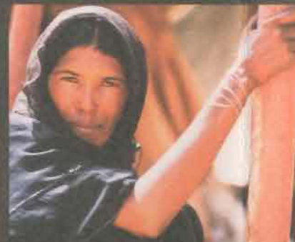
Dona nòmada tuareg