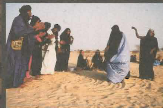
Nòmades tuareg interpretant les seves danses i cançons tradicionals