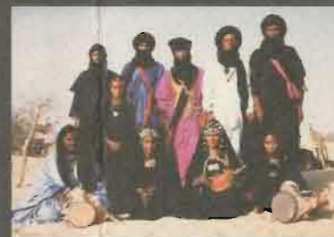
Grup de nòmades tuareg de la regió de Tombuctú que participaran al Festival Tuareg

Els tuareg constitueixen una de les ètnies més admirades del món. El seu origen continua essent força incert; es creu que provenen dels berbers del nord d'Àfrica, i de barreges amb els garamans de Líbia i altres tribus expulsades d'Egipte sobre l'any 900 de la nostra era.